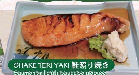
SHAKE TERIYAKI 鮭照り焼き Saumon grillé à la sauce soja douce