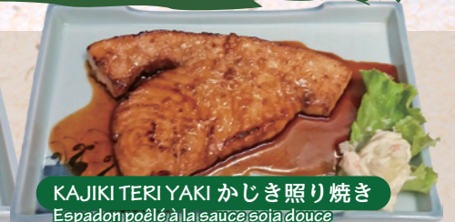
KAJIKI TERIYAKI かじき照り焼き Espadon poêlé à la sauce soja douce