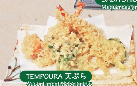
TEMPOURA 天ぷら Assortiment de beignets