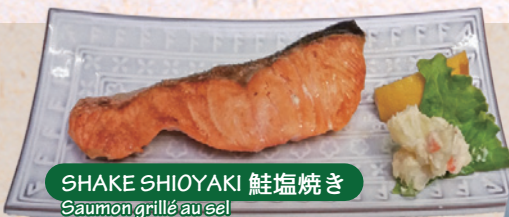
SHAKE SHIOYAKI 鮭塩焼き Saumon grillé au sel