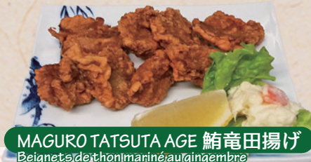
MAGURO TATSUTA AGE 鮪竜田揚げ Beignets de thon mariné au gingembre