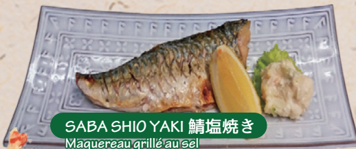
SABA SHIOYAKI 鯖塩焼き Maquereau grillé au sel