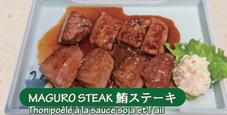
MAGURO STEAK 鮪ステーキ Thon poêlé à la sauce soja et l'ail